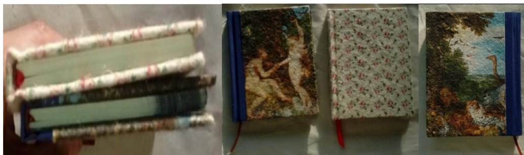
Libretas forradas con papel de lana y encuadernadas