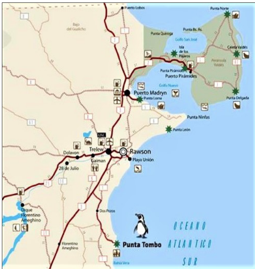
Comarca Virch-Valdés, Chubut, Patagonia Argentina