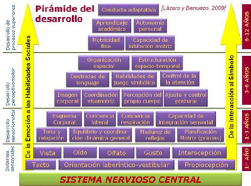
Figura 1 Pirámide de Desarrollo Humano